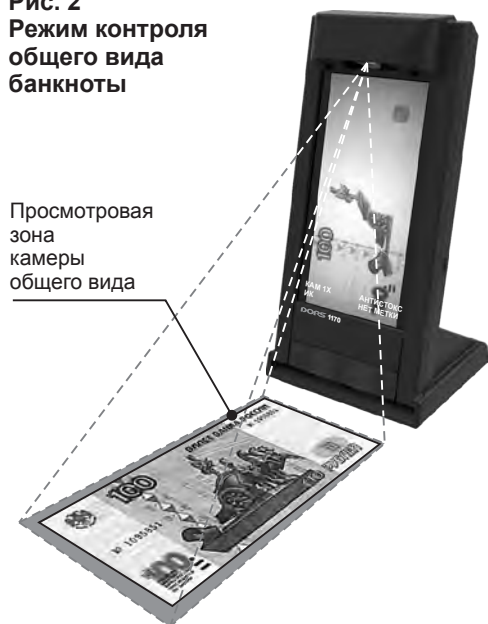
Рис. 2 Режим контроля общего вида банкноты