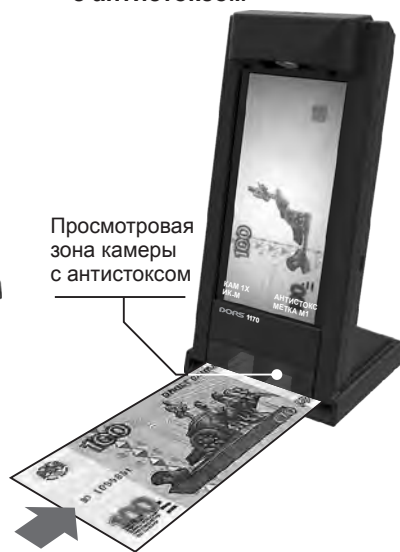
Рис. 3 Режим контроля банкноты с антистоксом